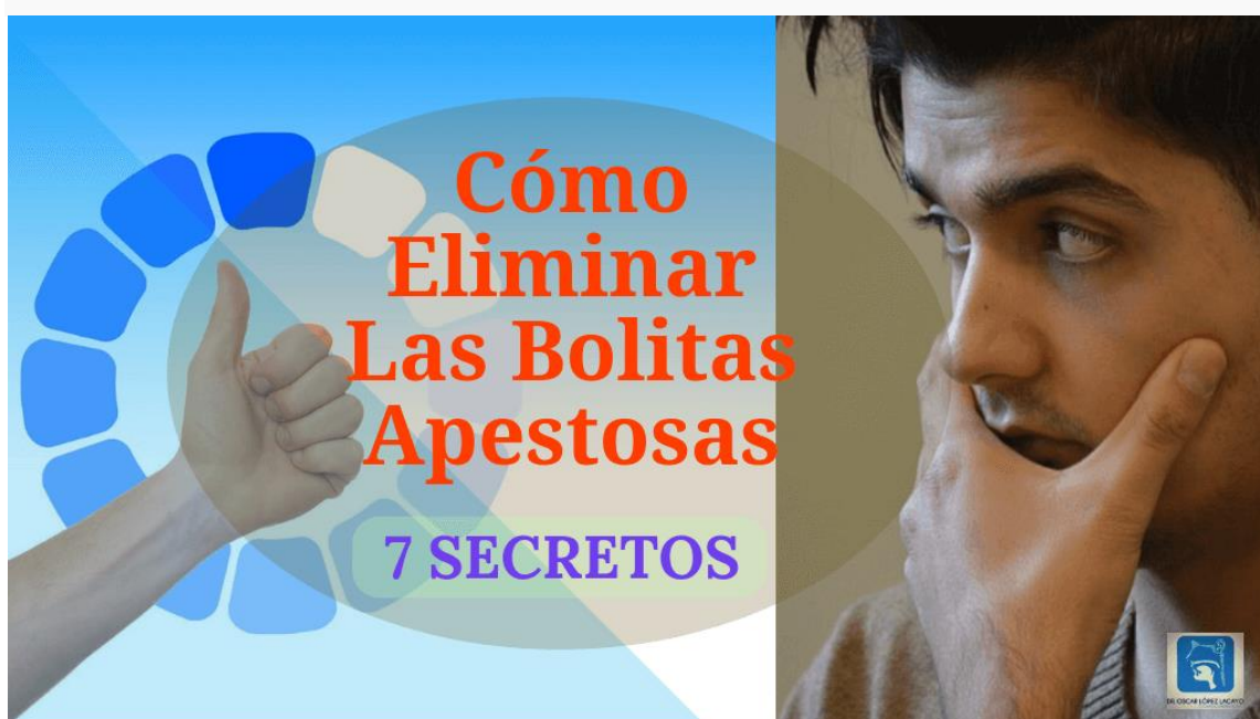
Tabla de contenidos [mostrar]

Como eliminar las bolitas blancas de la garganta apestosas, es algo que debes saber para que no tengas problemas de salud ni con el relacionamiento con las otras personas.