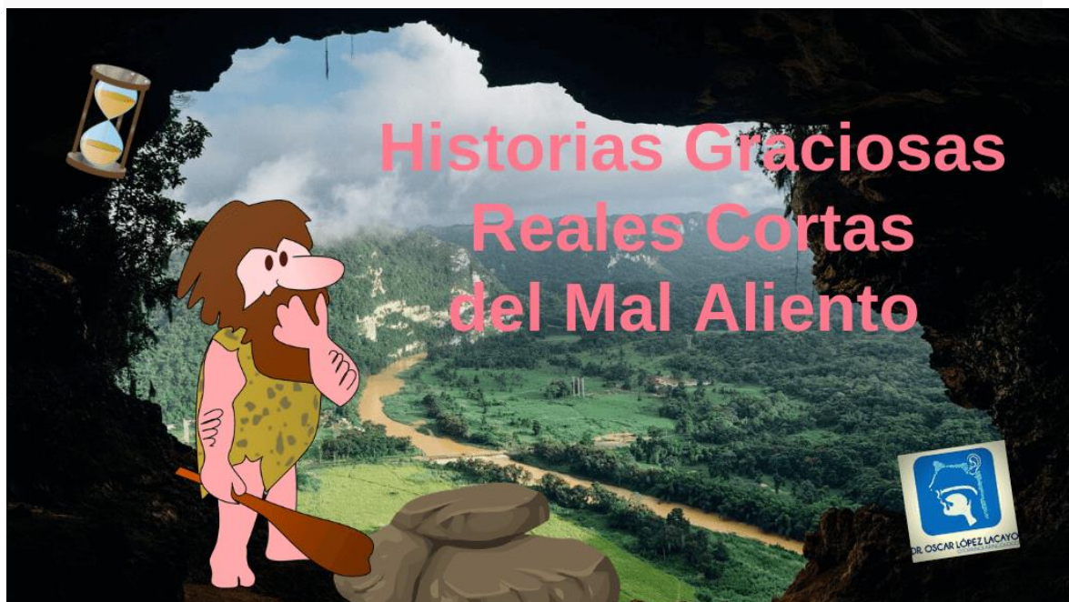
Tabla de contenidos [mostrar]

Te comparto algunas historias graciosas reales cortas del mal aliento, ocurridas a lo largo del tiempo.