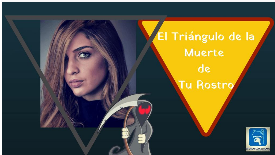
Tabla de contenidos [mostrar]

Triángulo de la muerte en tu cara? ¿Ya lo conoces y sabes su importancia?